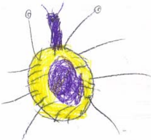
Figura 4: Dibujo de una vinchuca hecho por Simón, hijo de la autora, a los cinco años.

Me encontré con este texto, casi por casualidad (aunque debo aclarar que de grande me puse mística y a muchas casualidades las llamo «señales»... pero esa es