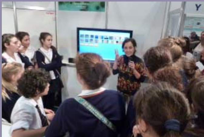
Figuras 6 y 7: Taller «Algunos cuadros, un reggae y un poema... raras excusas para hablar de Chagas». Dictado en «La Vidriera de los científicos del CONICET», en el marco del Espacio Joven de la 36 Feria Internacional del Libro de Buenos Aires. 4 de mayo de 2010.

Finalmente, considero que el universo de concepciones identificado permite, por un lado, obtener mayor conocimiento de los aspectos planteados y, por otro, rescatar la vigencia del problema del Chagas tanto en el ámbito rural como urbano, apuntando a reunir elementos que sean de utilidad para la elaboración de propuestas educativas que promuevan una mejor calidad de vida de las personas afectadas.