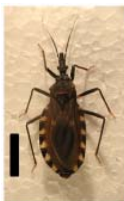
Figura 2: Adulto de vinchuca ( Triatoma infestans ). La barra negra representa un centímetro.

En cuanto a la evolución de la enfermedad, se observa que después de 10 días de incubación, la persona entra en una fase aguda generalmente asintomática o que presenta síntomas inespecíficos como dolor de cabeza, fiebre prolongada y malestar general. Luego de un período que dura aproximadamente dos o tres meses, comienza una etapa también asintomática donde dan positivos los análisis de laboratorio, pero aparentemente la persona no desarrolla ninguna alteración orgánica atribuible al Chagas. El 75% de los individuos infectados permanecerá en esta fase durante toda su vida, el resto evolucionará hacia una etapa crónica luego de 15 a 20 años, y desarrollará lesiones de diversa complejidad principalmente en el corazón, pero también en el tracto digestivo o el sistema nervioso (Coura, 2007).