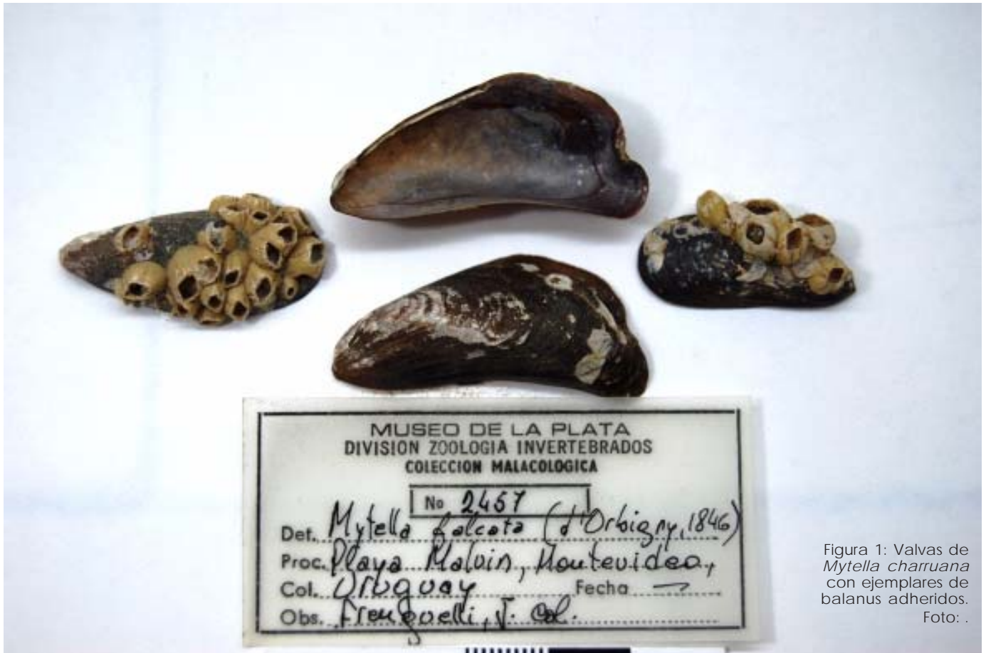
Figura 1: Valvas de Mytella charruana con ejemplares de balanus adheridos.