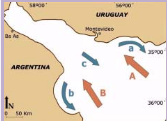
Principales zonas donde se registran salidas e intrusiones de aguas. Flecha azul: agua fluvial, Flecha roja: agua marina, a: costa uruguaya, b: costa argentina, c: centro del frente externo, A: costa uruguaya, B: costa argentina. (Figura tomada de Darrigran y Lagreca, 2005).

Los estuarios en general y el del Río de la Plata en particular son ecosistemas que sufren cambios periódicos en la salinidad producto de la mezcla de aguas por la influencia de los vientos. En pocas horas, el hábitat de los organismos cambia en forma marcada.