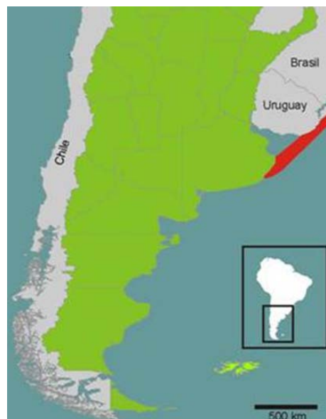
Figura 2. Distribución geográfica de las poblaciones actuales del bivalvo Donacidae Donax hanleyanus (área sombreada). Mapa tomado y modificado de: Gutiérrez et al., (2015).

estancan en el sedimento sin posibilidades de enterrarse) en el Piso Supralitoral, lo que es causa importante de mortalidad masiva. La densidad específica de la población varía local y estacionalmente, aumentando en los periodos de reclutamiento de nuevas generaciones.