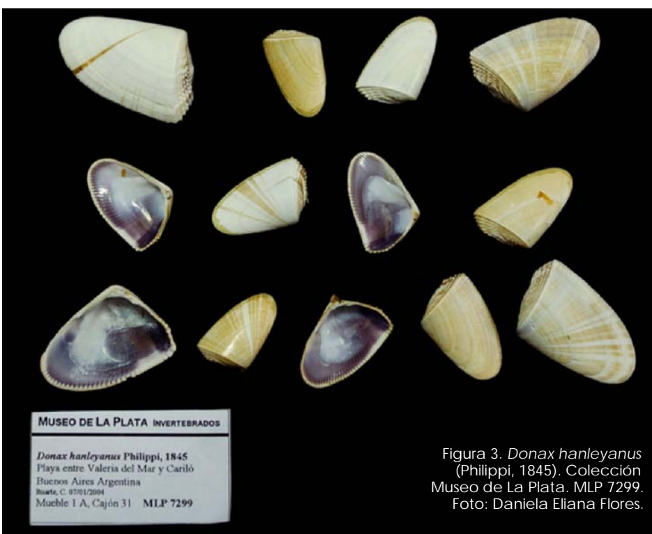
Figura 3. Donax hanleyanus (Philippi, 1845). Colección Museo de La Plata. MLP 7299.

Aunque a nivel mundial (en el Caribe, Europa, África, Asia y en Australia), varias especies de berberechos son el blanco del comercio y la pesca artesanal, D. hanleyanus no es comercialmente explotada aún en la Argentina, muy probablemente debido a la calidad de la carne relativamente baja y muy alto costo de extracción. Sin embargo se utiliza como cebo para la pesca recreativa. No obstante el berberecho es comestible, sabroso y se ofrece esporádicamente en restaurantes (Gutiérrez et al., 2015).