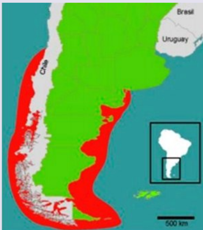
Figura 1. Distribución geográfica de las poblaciones actuales del bivalvo Ensis macha en el hemisferio sur (área de color rojo). Mapa tomado de: Gutiérrez et al. (2015).

En cuanto a la estructura poblacional, estudios sobre el litoral de Pisco en Perú, presentan altos niveles de densidad (79,1 Ind/m 2 ) y biomasa (2,8 kg/m 2 ), aunque se observa una tendencia descendente de estos valores, y un rango de tallas muy estrecho (90-175 mm), de tipo unimodal y con ausencia de la fracción juvenil en la población. Datos que señalan una sobreexplotación del recurso (Espinoza, 2006).