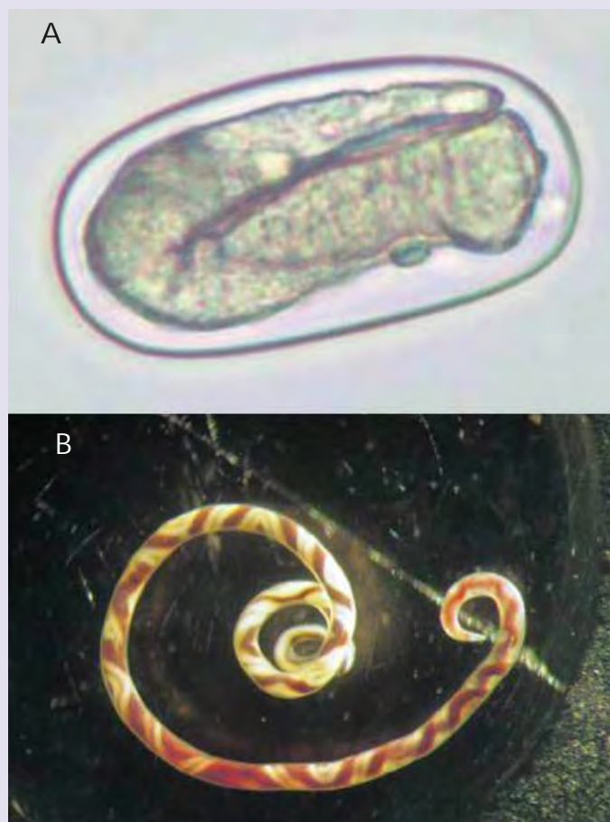
Figura 3. Estadios del parásito Angiostrongylus cantonensis : A: Huevo. B: Estadio adulto.

Angiostrongylus cantonensis es un nemátodo parásito, el cual causa meningitis eosinofílica en el hombre afectando su sistema nervioso central. Se presenta como una enfermedad aguda que se resuelve en semanas, en otros casos evoluciona de forma severa dejando secuelas irreversibles como la ceguera e incluso, puede provocar la muerte. El diagnóstico más común de esta enfermedad se da por síntomas y manifestaciones clínicas como cefalea intensa, rigidez en la nuca, sensación de hormigueo en el cuerpo, etc.), sumados al antecedente epidemiológico de vivir en áreas donde se encuentra el parásito y del hábito de ingerir caracoles crudos o mal cocidos (que pueden albergar larvas infectantes), así como también pescados y cangrejos que hayan ingerido caracoles infectados. Una forma menos común de transmisión es la ingestión de verduras contaminadas, agua o jugo de frutas (Ávala, et al., 2014).