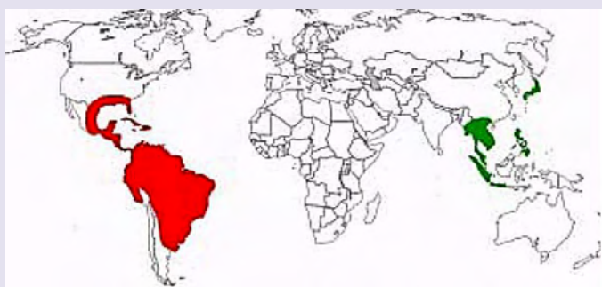
Figura 2. Distribución mundial del género Pomacea . En rojo: distribución nativa y en verde el área invadida .

Finalmente se lo ha estudiado intensamente como un potencial uso en control biológico (Vázquez-Silva, 2011), debido a que se considera un depredador de Biomphalaria peregriana (d'Orbigny, 1835), el cual es un caracol hospedador de la esquistosomiasis (Custodio et al., 2017).